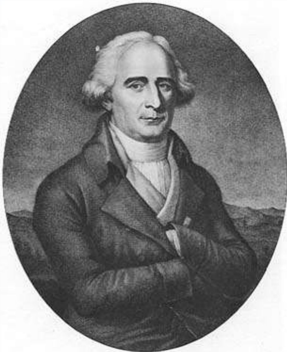
Joseph Michel Montgolfier