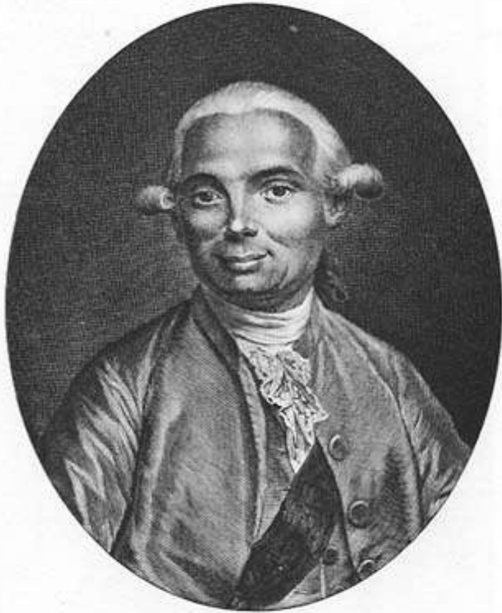
Jacques Etienne Montgolfier