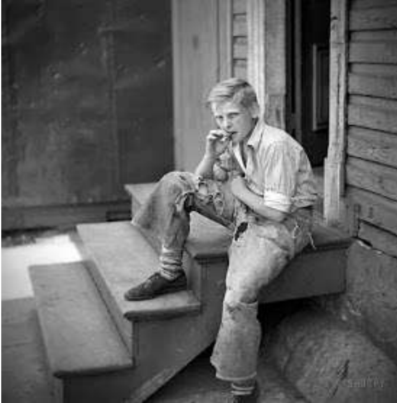
John Felix Vachon (1914-1975) Raggedy Andy